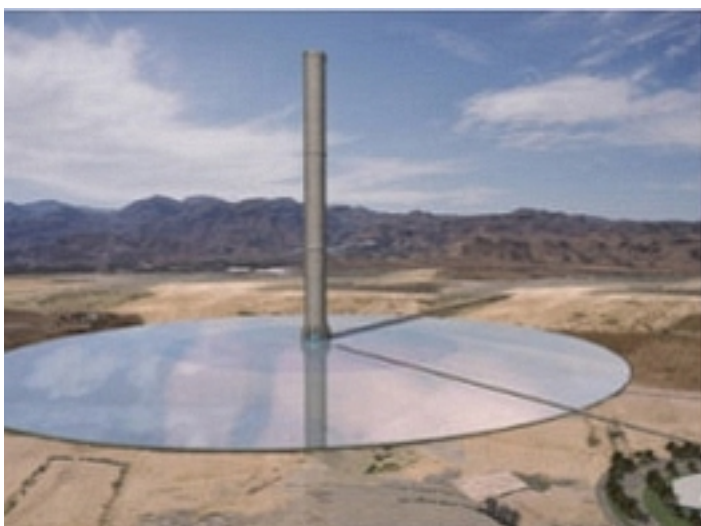
Figura 1.- En el suelo, debajo de la pantalla, se dispondrán cañerías con un gel que acumulará el calor del día para seguir generando electricidad en la noche.

subsuelos, tendremos que aceptar la barata energía solar a ojos vista en nuestras planicies desérticas.