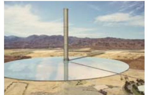
AdK_Schlaich-Berg_Aufwindkraftwerk 1 Entwurf für ein Aufwindkraftwerk, 2007