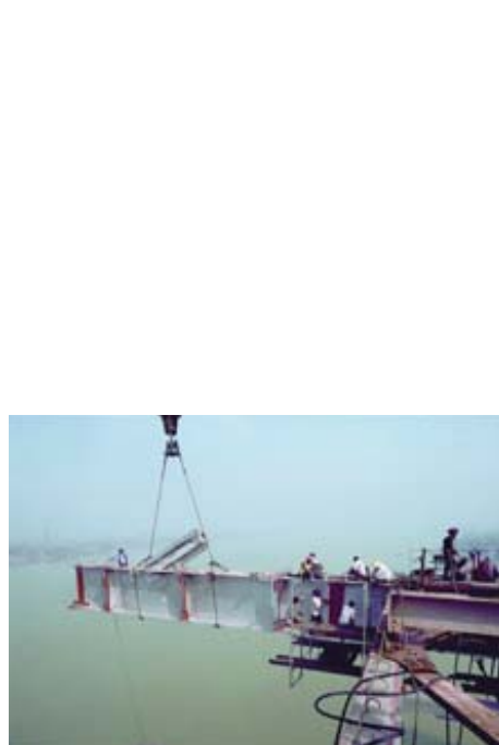
AdK_Schlaich-Berg_Brücke 3 Hooghly Brücke, Kolkata, Indien, im Bau, 1978–1992