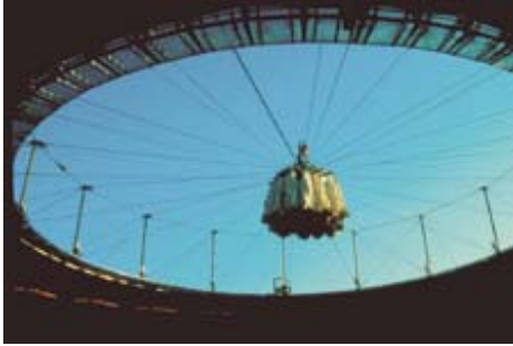
AdK_Schlaich-Berg_Saragossa 1 Wandelbares Dach der Stierkampfarena, Saragossa, Spanien, 1990

Passwort für Downloads auf www.adk.de bitte erfragen unter 030 200 57-1514 oder presse@adk.de