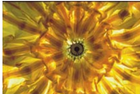
AdK_Schlaich-Berg_Saragossa_5 Wandelbares Dach der Stierkampfarena, Saragossa, Spanien, 1990