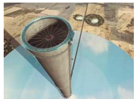
AdK_Schlaich-Berg_Aufwindkraftwerk 2 Entwurf für ein Aufwindkraftwerk, 2007 © Braake, Grobe, Stuttgart