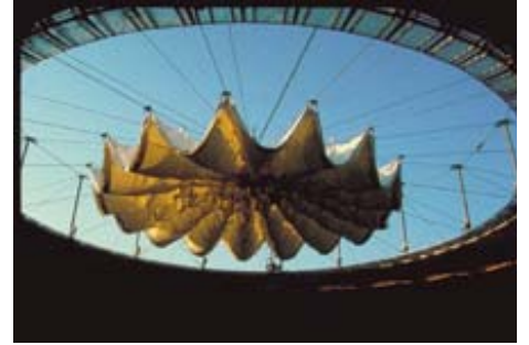
AdK_Schlaich-Berg_Saragossa 3 Wandelbares Dach der Stierkampfarena, Saragossa, Spanien, 1990