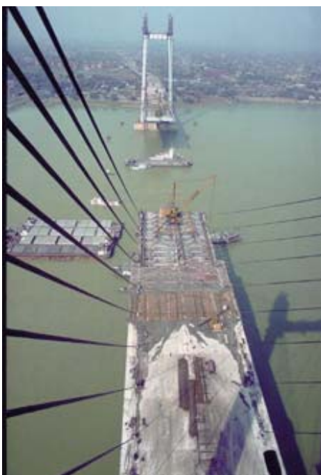
AdK_Schlaich-Berg_Brücke 1 Hooghly Brücke, Kolkata, Indien, im Bau, 1978–1992