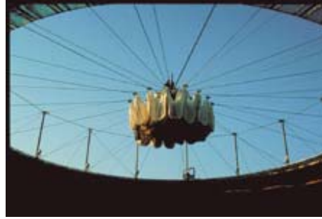
AdK_Schlaich-Berg_Saragossa 2 Wandelbares Dach der Stierkampfarena, Saragossa, Spanien, 1990